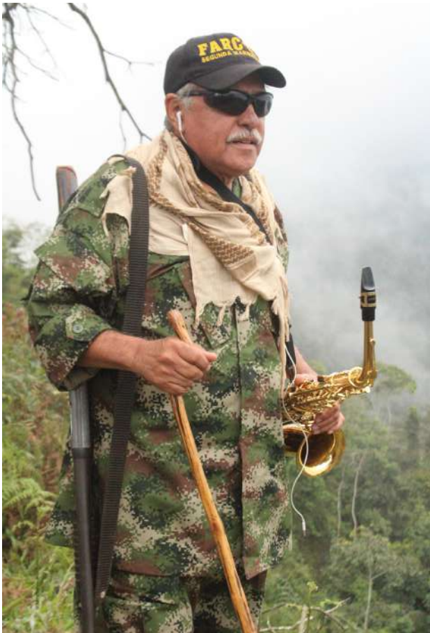
Jesús Santrich, el Discidente, Montañas de Colombia, FARC-EP, Segunda Marquetalia

Los que propugnan “la reconciliación” sin condiciones son perniciosos, tanto para los obreros como para los campesinos, indígenas y pobrerías en general, y no cumplen su deber de liberar estas capas de la hegemonía liberal.